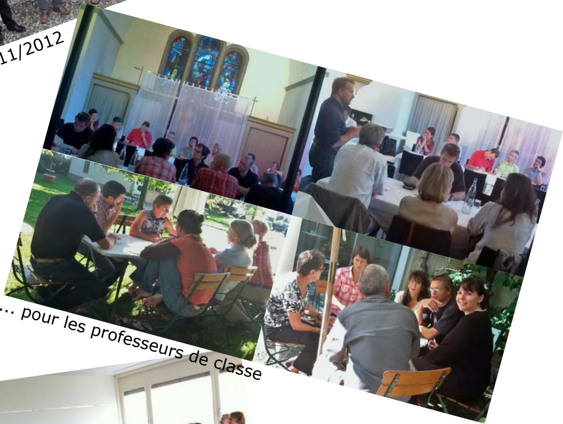
... pour les professeurs de classe