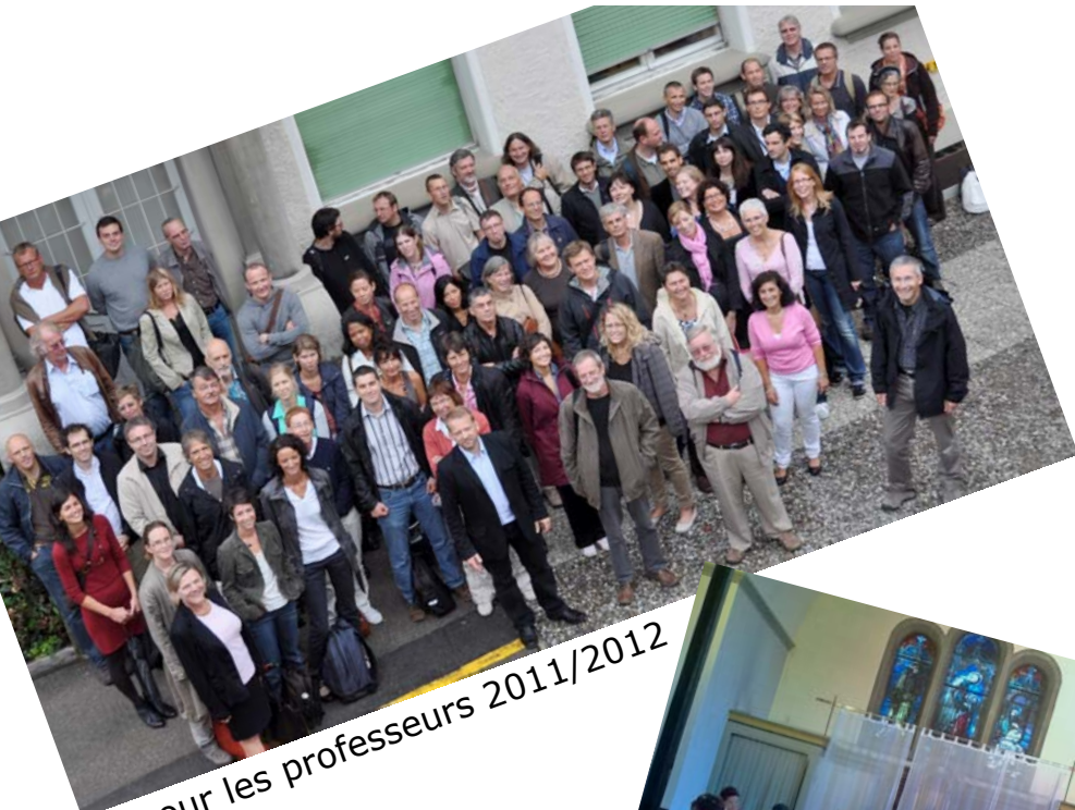
... pour les professeurs 2011/2012