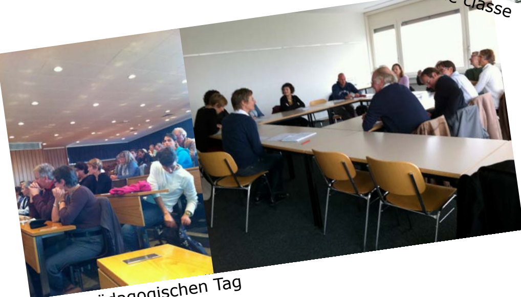
... am pädagogischen Tag